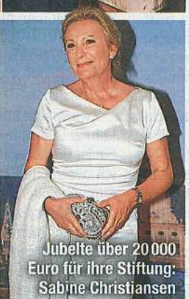
Jubelte über 20 000 Euro für ihre Stiftung: Sabine Christiansen