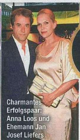
Charmantes Erfolgspaar: Anna Loos und Ehemann Jan Josef Liefers