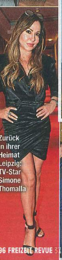
Zurück in ihrer Heimat Leipzig: TV-Star Simone Thomalla