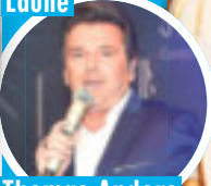
Thomas Anders unterhielt mit Hits wie „Your're my Heart, You're my Soul“