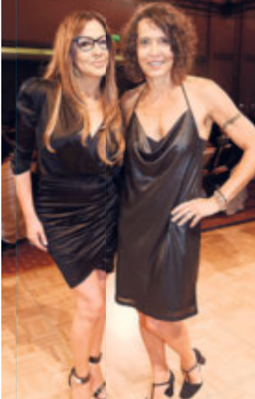
„Tatort“-Stars Simone Thomalla und Ulrike Folkerts