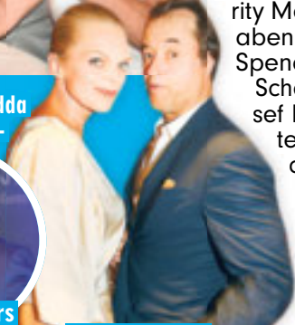
Anna Loos und Jan Josef Liefers feierten die Rekordsumme