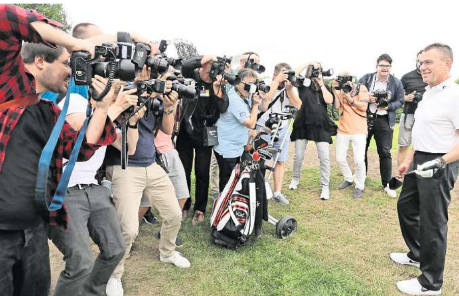
Medien-Magnet: Für RB-Sportdirektor und -Trainer Ralf Rangnick ist das 11. GRK Golf Charity Masters eine Premiere.