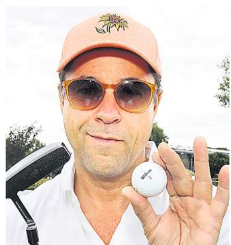
Siegerblick: Schauspieler Jan Josef Liefers ist Stammgast beim Golf-Event.